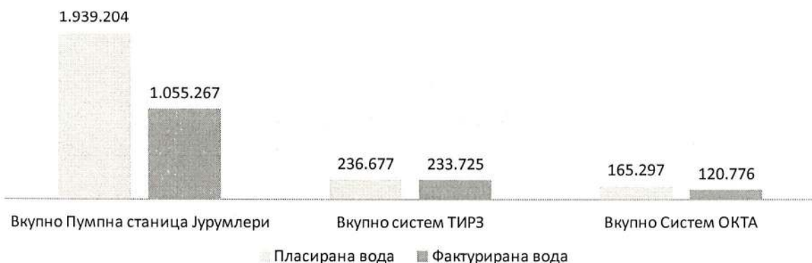
График 3: Вкупно пласирана и фактурирана вода прикажано по системи (m 3 )